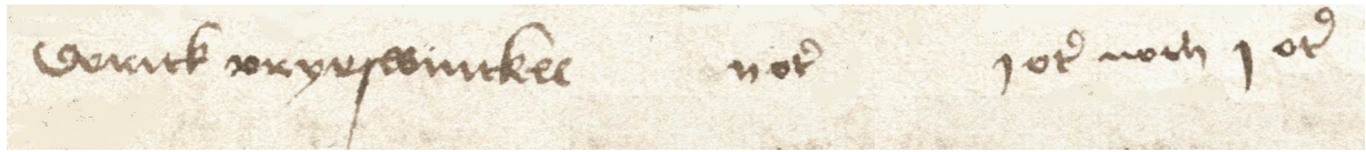
Abbildung 3: Ausschnitt von Seite 21, Transkription: Dereck Vryeswinckel 2 ort 1 ort noch 1 ort

Dereck Vryeswinckel aus dem „Ampt van Blankensteyne Sprockhoevell“ musste 2 Ort (= ½ Goldgulden) Steuern zahlen. Sein Besitz hatte demnach einem Wert von 12 1/2 Gulden, das entspricht etwa der Größe eines Kotten, d.h. eines einfachen Hauses mit Wohnung und Werkstatt. Die Steuer war an Martini (11. November) 1486 und 1487 je zur Hälfte fällig.